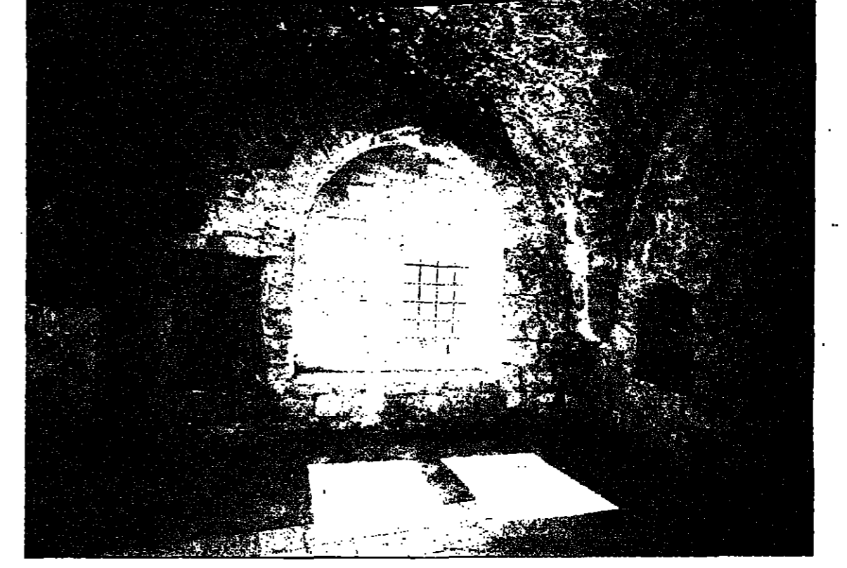
( من ارضيف قسم الآثار )

وقد اقيم قصر الشيخ في احد الاماكن الجميلة في القدس ، ومنه كان يمكن ان يطل المرء على البلدة القديمة ، وجبل الطور ، وادي الجوز ، والشيخ جراح ، لكون المنطقة كانت خالية من الممرات . وقد بني القصر بحجر حلي مقبيل ، وطابقت برزخان برامها الناظر من بعيد ، والمساحة البارزة من جدرانها الخارجية